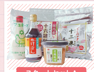
スタートセットA (食品・調味料セット)

※セット内容は予告なく変更する場合がございますのでご了承ください。開業届は別途提出が必要となります。