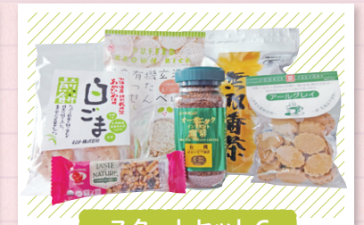
スタートセットC (お菓子セット)