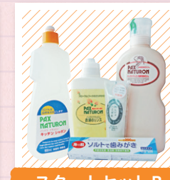
スタートセットB (日用雑貨品セット)