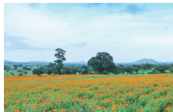
日差しが降り注ぐ広大な畑で育つアフリカン・マリーゴールド。畑の広さはなんと東京23区で最も大きい大田区とほぼ同じ！その鮮やかな花の色で、畑はまるでオレンジ色の絨毯を敷いたかのよう。