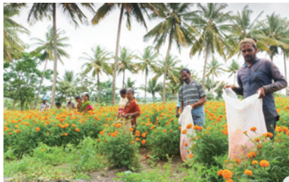
マリーゴールドの栽培はインドにおける雇用を創出し、社会貢献にもつながっています。