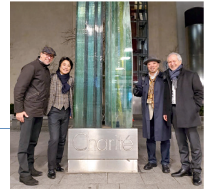
▲バイオズーム社のCEO(写真一番左)とプロジェクトの技術責任者(同一番右)と一緒に

シャリテ大学病院と30年以上のお付き合いがあるバイオズーム社。ラマン分光計を小型化した、カチックチェッカーのセンサーはバイオズーム社の技術によって実現しました。