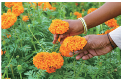
花の一つひとつを手作業で収穫しています。