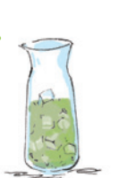
3. 氷が全部溶け切るまで冷蔵庫に入れておく。