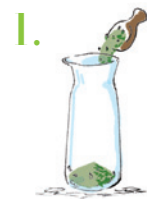
1. 手持ちのピッチャーの底に新茶を敷き詰める。

「氷出し」とはその名の通り、溶けた氷の雫でじっくりとお茶の甘味を引き出す方法。二番茶、三番茶でも「氷出し」をすれば甘味を引き出されますが、もともと甘い新茶であればその甘さは格別。さらに20℃以下の水で1時間以上じっくり時間をかけて緑茶を入れると「エピガロカテキン」というポリフェノールが抽出されやすくなるのが知られています。「エピガロカテキン」は免疫力を高める成分として、最近注目を集めています。