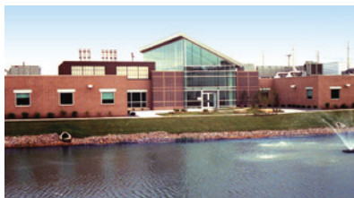
米国アイオワ州に本社を置くケミン・インダストリー社は、世界に生産拠点を14カ所、事業所を60カ所もつ世界的な企業。