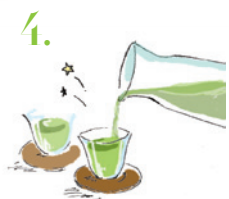
4. グラスなどに注いで飲む。