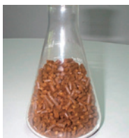
ベレット状にされたマリーゴールド