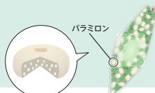
パラミロン断面 (イメージ図)

パラミロンを限界ギリギリまで増やしたミドリムシ「ユーグレナグラシリスEX55」が誕生。55%以上という高い含有率は業界トップレベル。