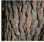
松樹皮エキス <ピクノジェノール®>

*P.C.I.国際特許出願制度により、特許協力条約に加盟している国 には出願し、複数の国認められた特許。