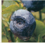
ビルベリーエキス <ミルトセレクト®>